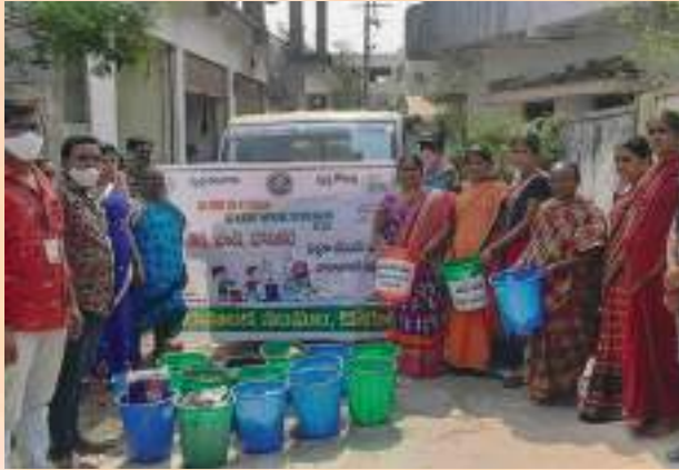
Korutla Municipality organising demonstration on Source Segregation- Alag Karo Campaign