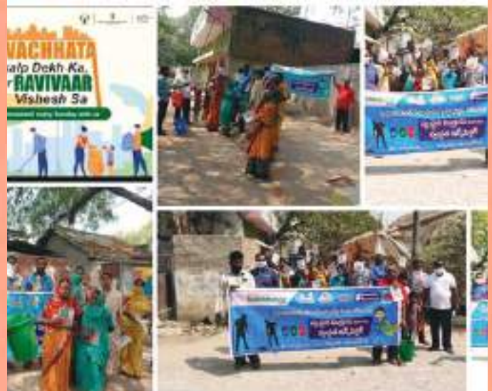
Nizamabad Municipal Corporation