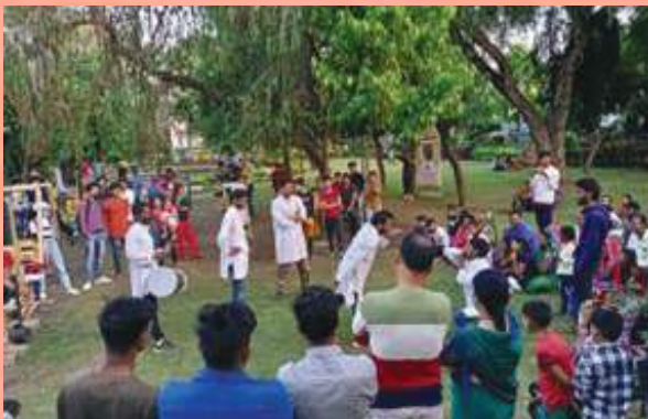
Nukkad Nataks were organized in Sagar ULB