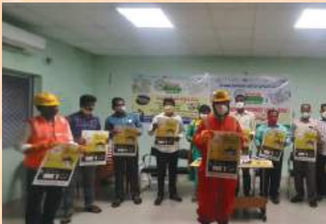
Ramagundam Municipal Corporation released IEC materials (House hold posters, truck Branding etc. ) for the Safaimitra Suraksha Challenge