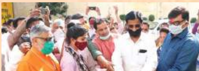
Saharanpur Nagar Nigam launched Kachre Ke Virudh Ek Yudh Campaign to sensitize locals on waste management