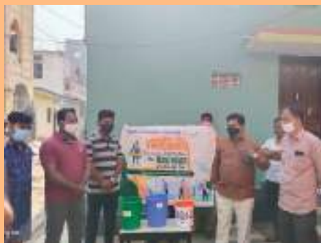
Awareness rally on waste segregation was carried out in Sangareddy Municipality