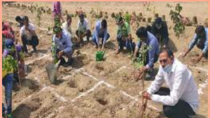
Celebrations of International Day of Forests by Ghaziabad Municipal Corporation