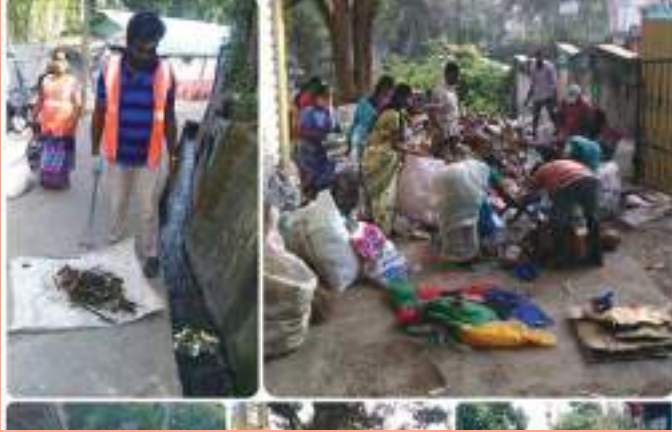
Port Blair Municipal Council