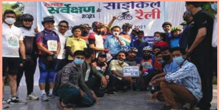
Swachhata Rally in full swing in Satna