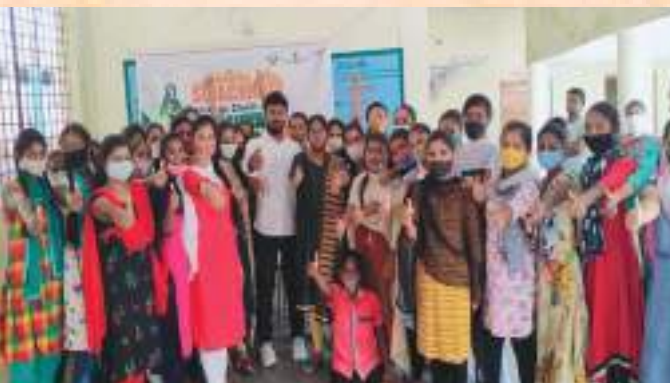
Andole-Jogipet municipality conducted quiz competition on Swachh Sarvekshan 2021 at Women's Residential college hostel