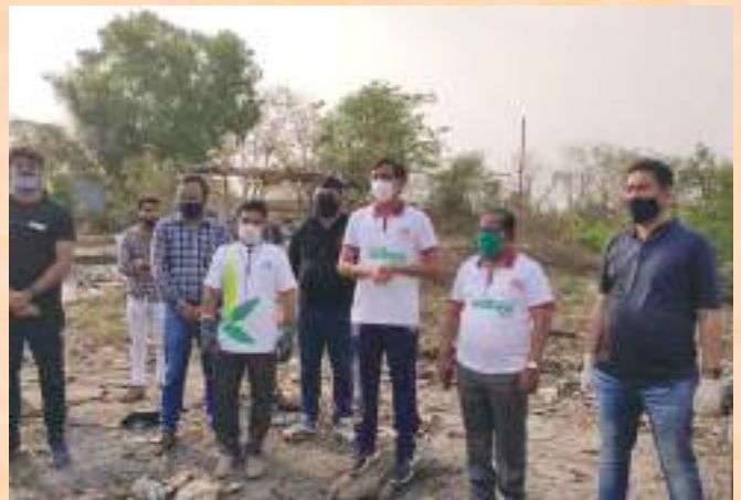
Cleanliness drive undertaken by Navi Mumbai Municipal Corporation (NMMC)