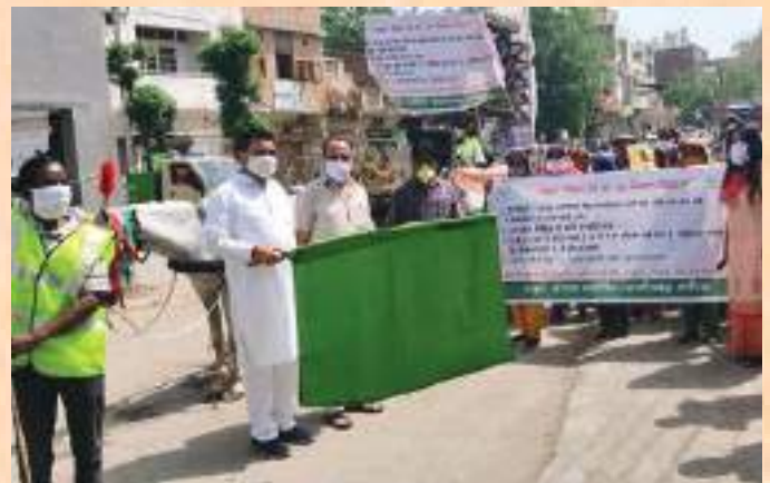
MC Sirhind Fatehgarh Sahib