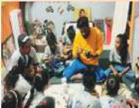
Swachhata Ki Pathshala in Bhopal, teaching students and citizens to make best out of waste