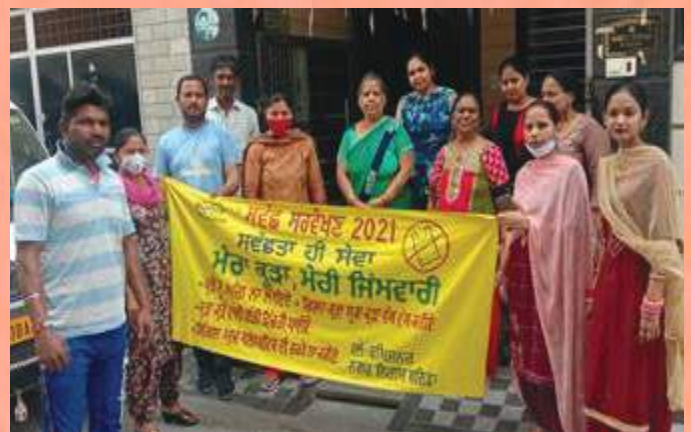
Municipal Corporation Bathinda