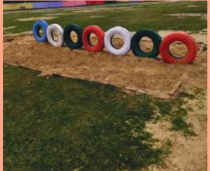
Stadium-cum-park decorated by waste materials by MC Ferozepur