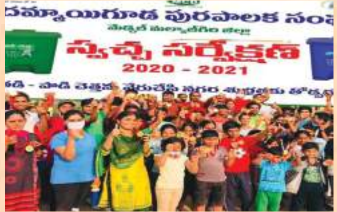
Dammaiguda Municipality mobilised the school children and conducted workshop on Source Segregation