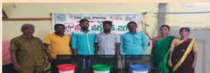
Pochampally Municipality organised demonstration on waste segregation