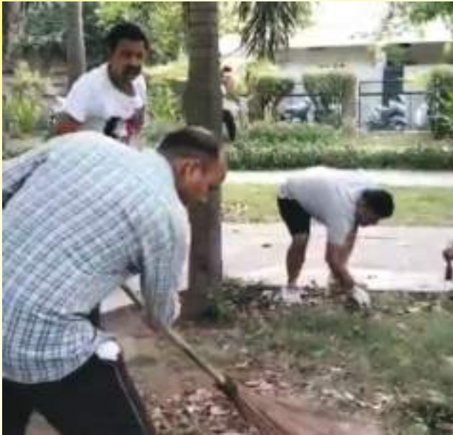
Clean up drive in Barnala