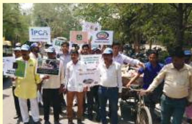
IPCA in association with EDMC conducted a clean up drive on Plastic Bag Free Day In the Karkardooma Market area