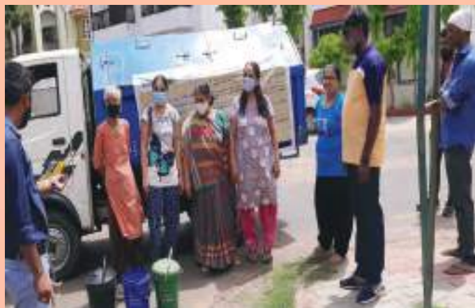
Source Segregation Campaign in Gandhinagar