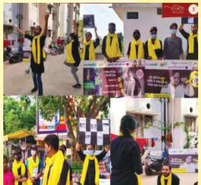
Nukkad Natka organized in Municipal Corporation Patti