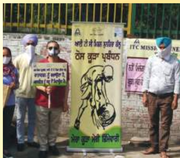
International Plastic Bag Free Day celebrations at MC Kapurthala