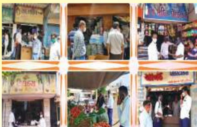
Single-Use Plastic Seize Drive in Rajkot