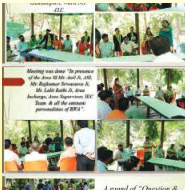
Awareness campaign on source segregation by East Delhi Municipal Corporation