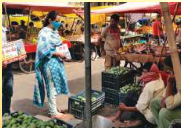
Vendor to Vendor Awareness on International Plastic Bag Free day in Patiala