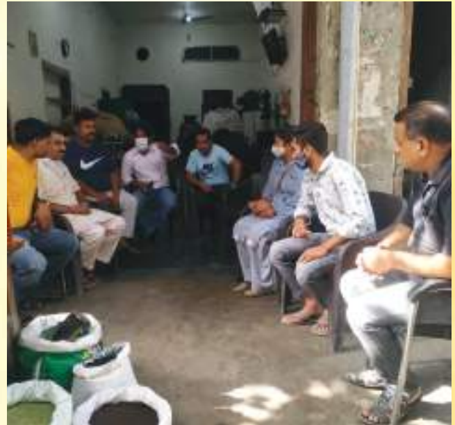
ULB Ferozpur organized a meeting with District Committee of Punjab Municipal Pensioners Association on eliminating Single-Use Plastics Home composting