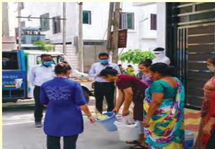
Source Segregation Campaign in Surat