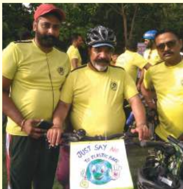
Awareness on International Plastic Bag Free day in Bhatinda